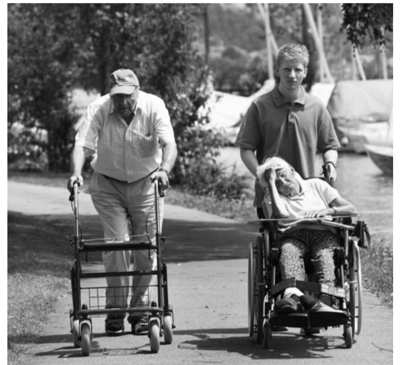
Wertvoller Dienst an der Gesellschaft.

Die Massnahmen fünf (Keine Zulassung von Angehörigen der Armee mit null Restdiensttagen), sechs (Jährliche Einsatzpflicht ab Zulassung) und sieben (langer Zivildienstesatz im ersten Kalenderjahr ab Zulassung) sollen die Gleichwertigkeit der beiden Dienssysteme garantieren. Die beiden Dienste sind aber gar nicht erst vergleichbar: Der Wehrzwang ist ein verfassungsrechtlicher Fehler, welcher der heutigen Zeit nicht mehr entspricht. Der Zivildienst ist ein Ersatz dafür, der sich zum einem sozial relevanten Pfeiler der Gesellschaft gewandelt hat. Gewinnbringender für die Schweiz wäre es, den Zivildienst unabhängig vom Militär zu gestalten, anstatt alle Dienstwilligen an der Waffe zu vergraulen.