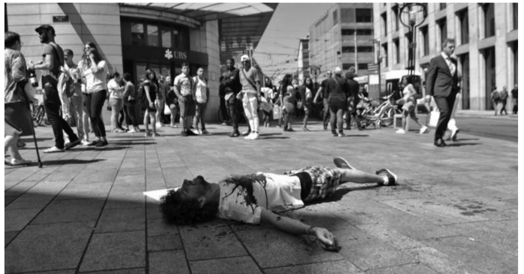
Medienwirksame Aktion in Genf gegen das blutige Geschäft der Banken.

Mit diesem zusätzlichen Druck ihrer KundInnen hoffen wir, dass die UBS und die Credit Suisse den Weg der Publica und anderer Pensionskassen beschreiten werden, die bereits beschlossen haben, nicht mehr in das Geschäft mit dem Tod zu investieren.