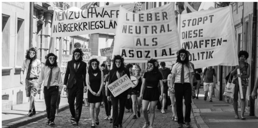
StandUpForPeace in Aktion

Unser Hauptziel bleibt die Bevölkerung durch mehrere kleinere oder auch grössere Aktionen auf die Schweizer Waffenpolitik aufmerksam zu machen. #StandUpForPeace und zwar jetzt .