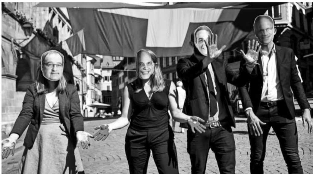
GSoA-Aktion gegen die KMV-Lockerung

Was die Lockerung der KMV betrifft, wird am Ende der verschiedenen parlamentarischen Prozesse innerhalb der Kantone der Bundesrat wiederholt Widerstand zu spüren bekommen. Diesen muss er berücksichtigen, will er nicht Gefahr laufen, zahlreiche Nichtregierungsorganisationen, Verbände, Parteien, und Kantone komplett vor den Kopf zu stossen!