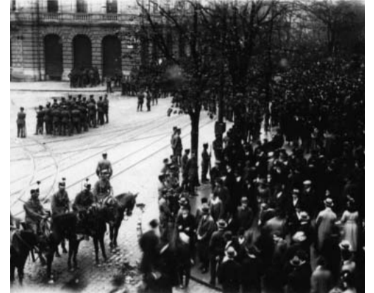
Die Kavallerie im Einsatz gegen DemonstrantInnen auf dem Zürcher Paradeplatz 1918.

Vor allem ging es weiter mit den Militäreinsätzen gegen Streikende und NazigegnerInnen. So wurden beim Basler Generalstreik von 1919 fünf Arbeitende erschossen und mehrere verletzt. Wie reaktionär die Armee war, zeigen ihre häufigen Einsätze gegen antinazistische Kundgebungen. An einer solchen wurden in Genf am 9. November 1932 13 Antifaschisten erschossen und 65 verletzt. Unter den Toten war ein Vater, dessen Sohn als Rekrut mitgeschossen musste.